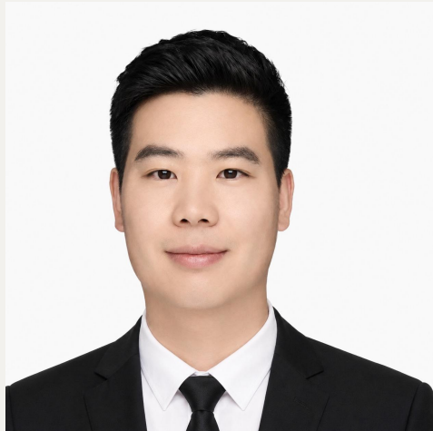
Usulan Calon Direktur