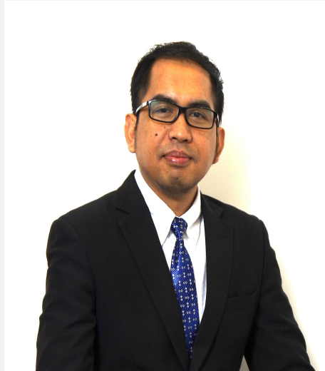
Usulan Calon Komisaris Independen