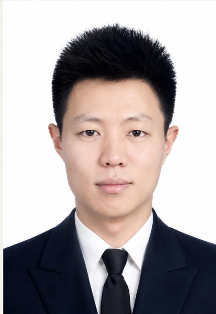
Usulan Calon Komisaris Utama