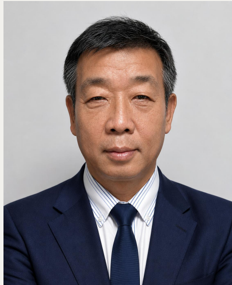
Usulan Calon Direktur Utama