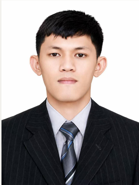
Usulan Calon Komisaris